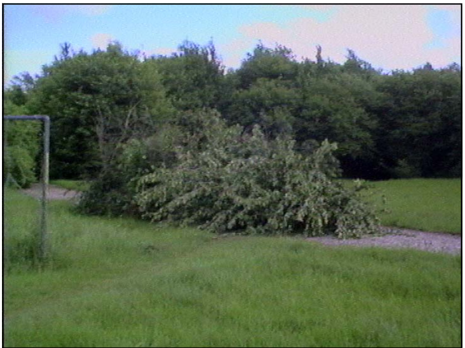
Fredag, den 23. juni mellem kl. 21-21.30 antændes dette bål?

Hvis der er nogen af medlemmerne, der har en heks (altså en tøjheks) til afbrænding, må de da gerne placere den på toppen af bålet.